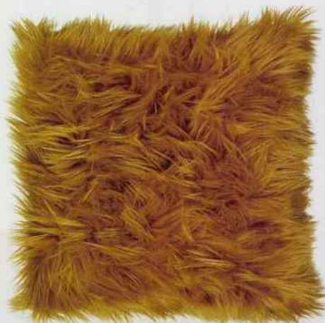
Cette housse de coussin façon fourrure allie douceur et chaleur. L. 40 x l. 40 cm. 14,99 €. La Redoute Intérieurs.