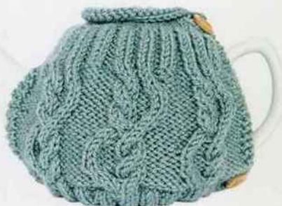
Ce couvre-théière en laine garde votre thé au chaud plus longtemps. Il est fermé par deux magnifiques boutons en bois. 28,17 €. Etsy.