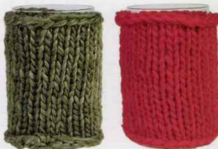
Les photophores s'équipent de chaussettes pour une lueur encore plus douce. Maille H. 16 x Ø 10 cm. 24 € le set de 2. Côté table.