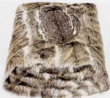
L'hiver cristallise notre envie de s'envelopper de la réconfortante touche de luxe qu'apporte la broderie à ce plaid en fausse fourrure. L. 150 x P. 130 cm. 160 €. MX Home. Maisons du Monde.