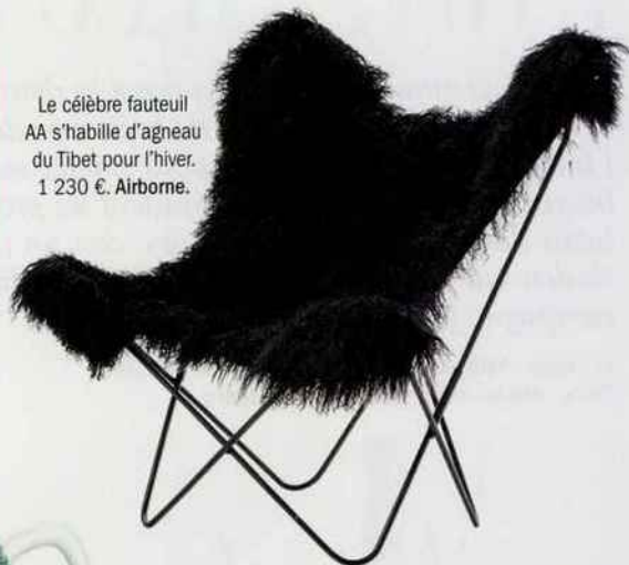
Le célèbre fauteuil AA s'habille d'agneau du Tibet pour l'hiver. 1 230 €. Airborne.