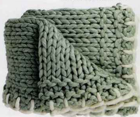
Les maille XXL multiplient l'effet de chaleur de la laine tricotée. En laine et acrylique. L. 170 x l. 130 cm. 120 €. Côté Table.