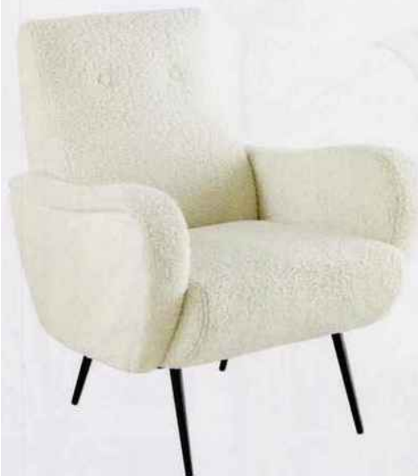
Misez sur le moelleux d'un fauteuil à effet peau de mouton et doté d'un large dossier. H. 86 x L. 72 x P. 84 cm. 449 €. Maisons du Monde.