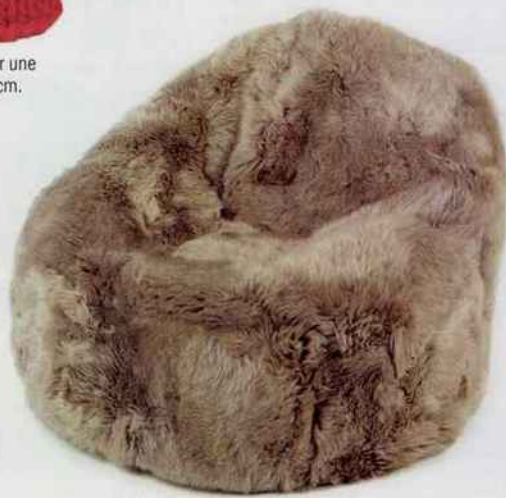
Invitation à une pause moelleuse avec ce pouf en fourrure qui joue à plein les codes de l'hiver. H. 80 x Ø 70 cm. 735 €. Le Monde Sauvage.