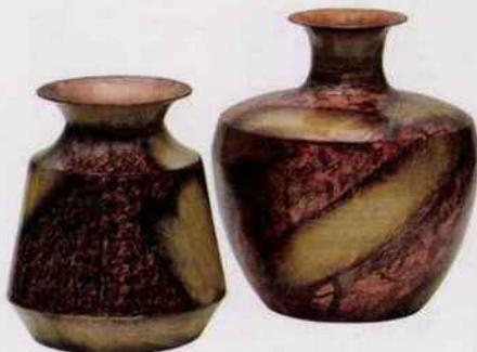
Vases Spot On. Acier recyclé avec finition cuivrée. BePureHome. 47 €.