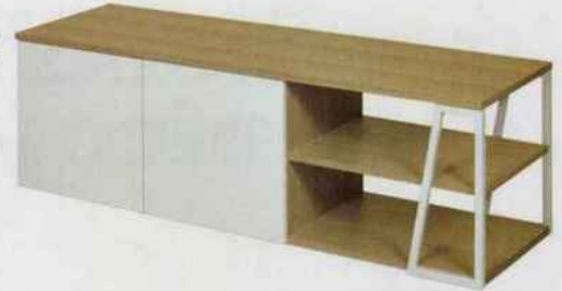
Meuble TV Albi. Chêne recyclé et acier laqué. Également disponible en noyer recyclé et coloris noir. Fabriqué au Portugal. Tema Home. 479 €.