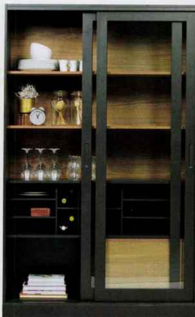
Vaisselle James. Pin massif FSC et verre. Fabriqué aux Pays Bas. Wood. 723 €.