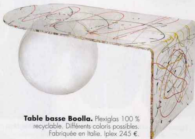
Table basse Boolla. Plexiglas 100 % recyclable. Différents coloris possibles. Fabriquée en Italie. Iplex 245 €.