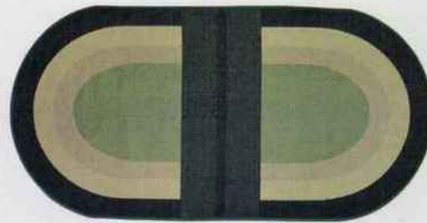
Tapis Pill. 100 % de fibres de polyester recyclé. Hydrofuge. 100 x 200 cm. Hübsch. 86 €.