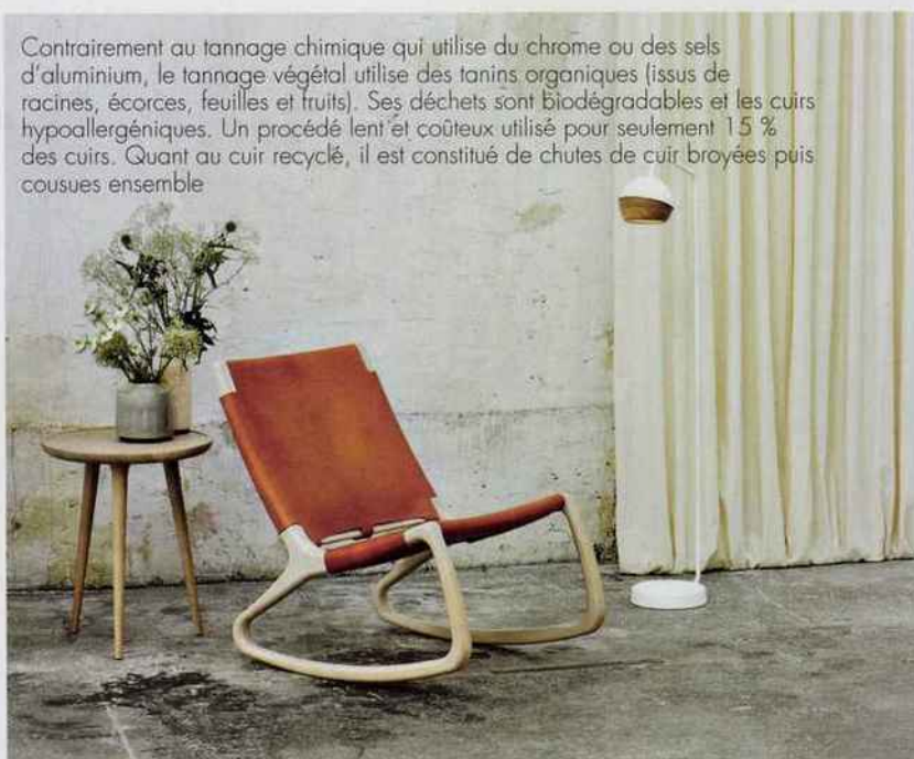
Fauteuil Ninna. Structure en bois de frêne massif et assise en cuir au tannage végétal. Fabriqué en Italie. Adentro. 899 €.

Contrairement au tannage chimique qui utilise du chrome ou des sels d'aluminium, le tannage végétal utilise des tanins organiques (issus de racines, écorces, feuilles et fruits). Ses déchets sont biodégradables et les cuirs hypoallergéniques. Un procédé lent et coûteux utilisé pour seulement 15 % des cuirs. Quant au cuir recyclé, il est constitué de chutes de cuir broyées puis cousues ensemble.