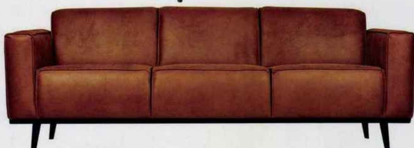
Canapé Statement. Revêtement en cuir recyclé. Suspension à ressorts Bonnell, mousse et ouate. Rembourrage du dossier en mousse polyuréthane haute résilience et ouate. 3 / 4 / 6 places ou avec angle. BePureHome. A partir de 1 186 €.