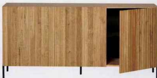
Buffet Engraving. Chêne FSC et métal noir. Fabriqué aux Pays Bas. Wood. 758 €.