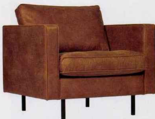
Fauteuil Rodeo. Revêtement en cuir recyclé. Rembourrage de l'assise en mousse polyuréthane. Rembourrage du dossier en mousse polyuréthane et Comforel. BePureHome. 648 €.