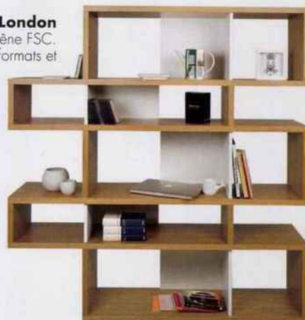
Bibliothèque London 002. Chêne FSC. Nombreux formats et coloris possibles. Fabriquée au Portugal. Tema Home. 756 €.