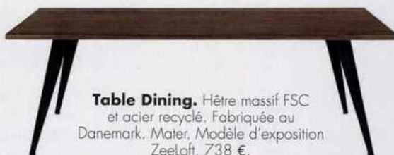
Table Dining. Hêtre massif FSC et acier recyclé. Fabriquée au Danemark. Mater. Modèle d'exposition Zeeloft. 738 €.