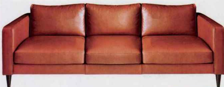
Canapé Noa en cuir pleine fleur et tannage végétal. Maison Sarah Lavoine, 7 680 €.