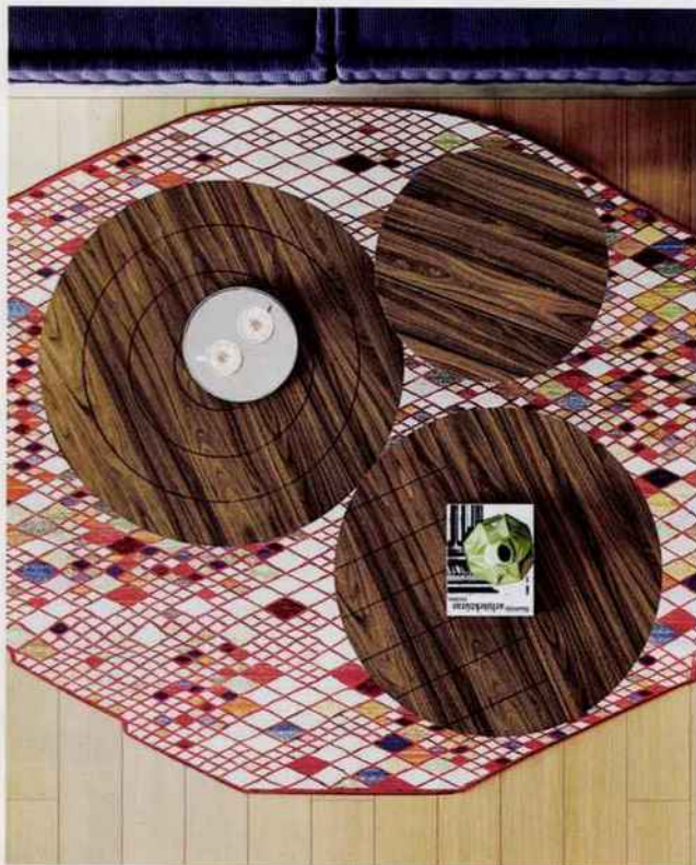
Tables basses Ply. Bois de noyer ou de chêne FSC. Fabriquées au Portugal. Tema Home. A partir de 146 € la table.

Le bois labellisé Forest Stewardship Council (une organisation à but non lucratif) provient de forêts éthiques et écologiques. On y veille au respect des peuples indigènes et des ouvriers, à l'impact environnemental et au maintien des ressources forestières.