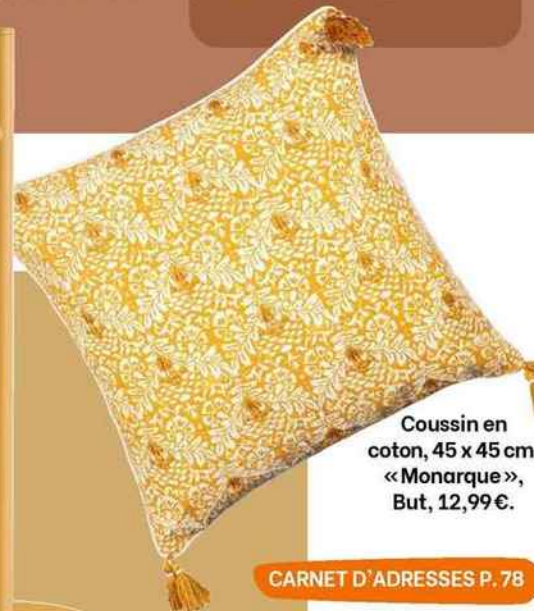
Coussin en coton, 45 x 45 cm «Monarque», But, 12,99 €.