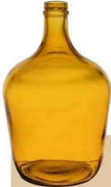
Vase bouteille en verre recyclé, H 32 cm. «Comète», Sema Design, 26,90 €.