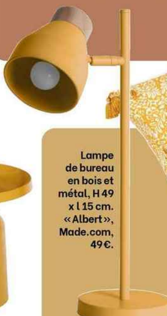
Lampe de bureau en bois et métal, H 49 x l 15 cm. «Albert», Made.com, 49 €.