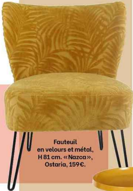
Fauteuil en velours et métal, H 81 cm. «Nazca», Ostaria, 159 €.

Réchauffez votre intérieur en parsemant ça et là des touches d'ocre lumineux. PAR SYLVIE BADET ET AMÉLIE DE MENOÛ