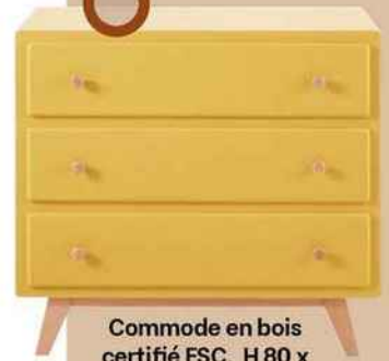
Commode en bois certifié FSC, H 80 x L 85 x P 42 cm. «Sweet 2», Maisons du Monde, 229 €.

CETTE TEINTE DORÉE ÉCLAIRE ET PIMENTE LES COULEURS FONCÉES, BRUN, NOIR, MARINE.