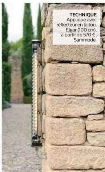
TECHNIQUE Applique avec réflecteur en laiton. Elgar (100 cm), à partir de 570 €, Sammode.