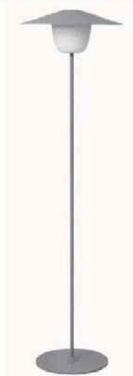
LONGILIGNE Lampadaire à leds rechargeable, en aluminium et acier. Ani Lamp Floor (12 x 34 cm), 195 €, Blomus.