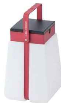
SOLAIRE Lanterne en aluminium, 300 lumens. Bump (21 x 17 x 17 cm), 99 €, SEL Les Jardins chez Camif.