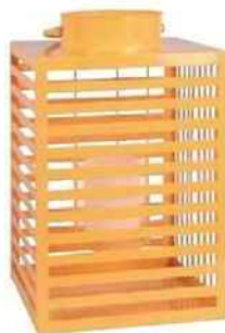
AJOURÉE Lanterne, en métal. Gandha (35 x 22 x 22 cm), 24,99 €, Maisons du monde.