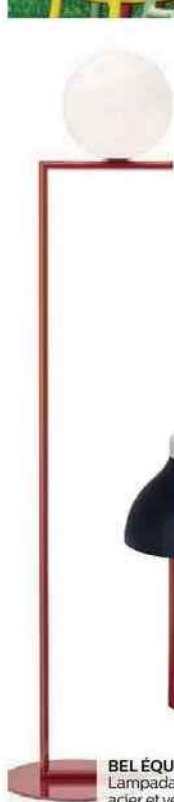
BEL ÉQUILIBRE Lampadaire en laiton, acier et verre soufflé. IC F1 (135 cm), 680 €, Flos.