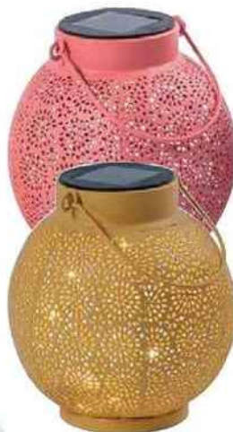
OUVRAGÉE Lanterne avec 5 leds. Mini Saru (Ø 10 cm), 6,95 € l'une, Casa.