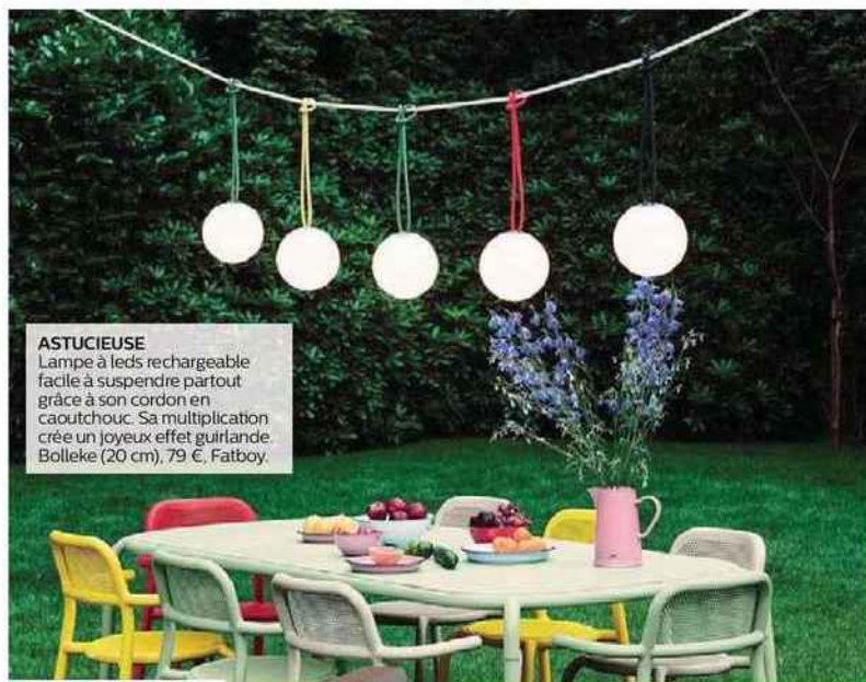
ASTUCIEUSE Lampe à leds rechargeable facile à suspendre partout grâce à son cordon en caoutchouc. Sa multiplication crée un joyeux effet guirlande. Bolleke (20 cm), 79 €, Fatboy.