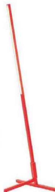
TRAIT DE LUMIÈRE Luminaire en aluminium laqué, design Studio 5.5. Vertical Torch Sutra (256 x 54 x 38 cm), à partir de 340 €, Ego.