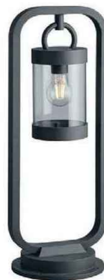
INDUS' Lanterne en fonte d'aluminium. Sambesi (100 x 23 x 21 cm), 165 €, Keria.