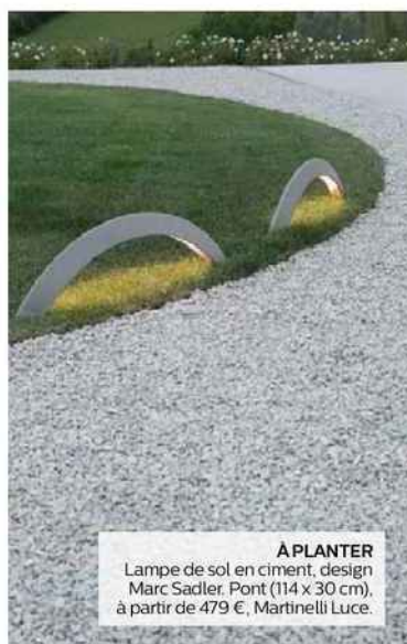
A PLANTER Lampe de sol en ciment, design Marc Sadler. Pont (114 x 30 cm), à partir de 479 €, Martinelli Luce.