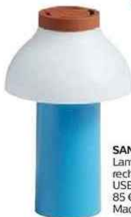
SANS FIL Lampe à poser, rechargeable par USB (22 x 14 cm), 85 €, Hay chez Made in Design.