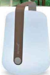
NOMADE Lampe rechargeable, poignée en aluminium. Balad (25 x 19 cm), 77 €, Fermob.