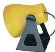
ORIENTABLE Lampe à poser en aluminium. Frog (30 x 25 x 22 cm), 295 €, Martinelli Luce.