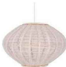
LÉGÈRE Suspension en textile et rotin. Borneo (43 x 26 cm), 212 €, Globen Lighting chez Lightonline.