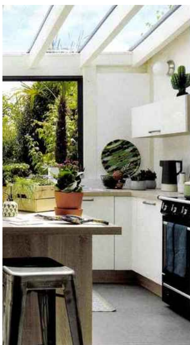
Vie et Veranda