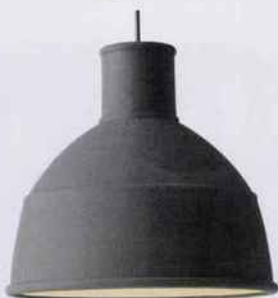
Cette suspension réinterprète le style industriel en utilisant une matière originale : le caoutchouc. H. 30 x Ø 33 cm. 169 €. Muuto. Le Cèdre Rouge.