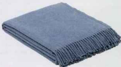
Plaid en polaire à franges. L. 180 x l. 140 cm. 44 €. Euromant. Westwing Now.