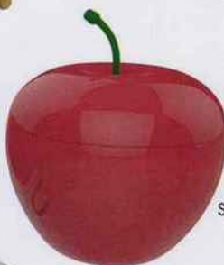
Seau à glace et pince assortie. H. 18 x Ø 16 cm. 12,90 €. Cecoa. Amazon.