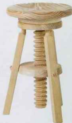
Tabouret à vis en pin massif brut. H. 48 à 65 cm. 40,50 €. Le Grenier Alpin.