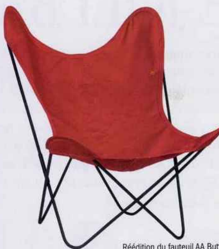
Rédition du fauteuil AA Butterfly. Structure en fil d'acier et housse en toile 100 % coton, très résistante. H. 90 x L. 70 x P. 70 cm. 497 €. AA, New Design.