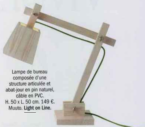
Lampe de bureau composée d'une structure articulée et abat-jour en pin naturel, câble en PVC. H. 50 x L. 50 cm. 149 €. Muuto. Light on Line.