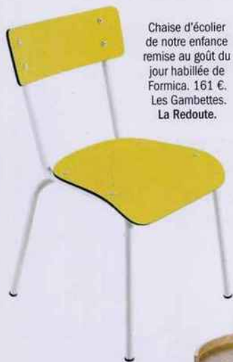
Chaise d'écolier de notre enfance remise au goût du jour habillée de Formica. 161 €. Les Gambettes. La Redoute.