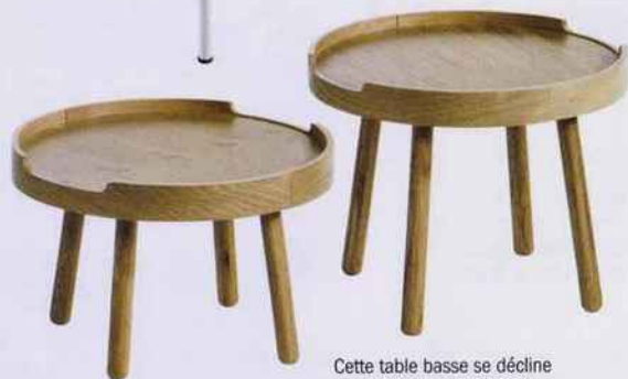
Cette table basse se décline en 3 hauteurs. Plateau en placage chêne et pieds en chêne massif. À partir de 69 €. AM.PM.