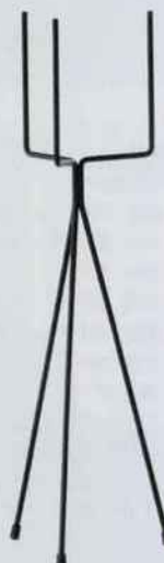
Faites prendre de la hauteur à vos plantes sur ce support en acier laqué. H 65 x Ø 15 cm. 35 €. Ferm Living. Made in Design.