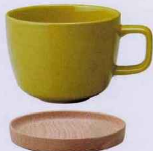
Tasse en porcelaine japonaise avec une soucoupe en bois qui peut servir de couvercle. 23,99 €. Kinto. Escale Sensorielle.