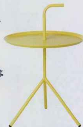
Table d'appoint en acier satiné. H. 53 x Ø 49 cm. 37,95 €. Sklum.