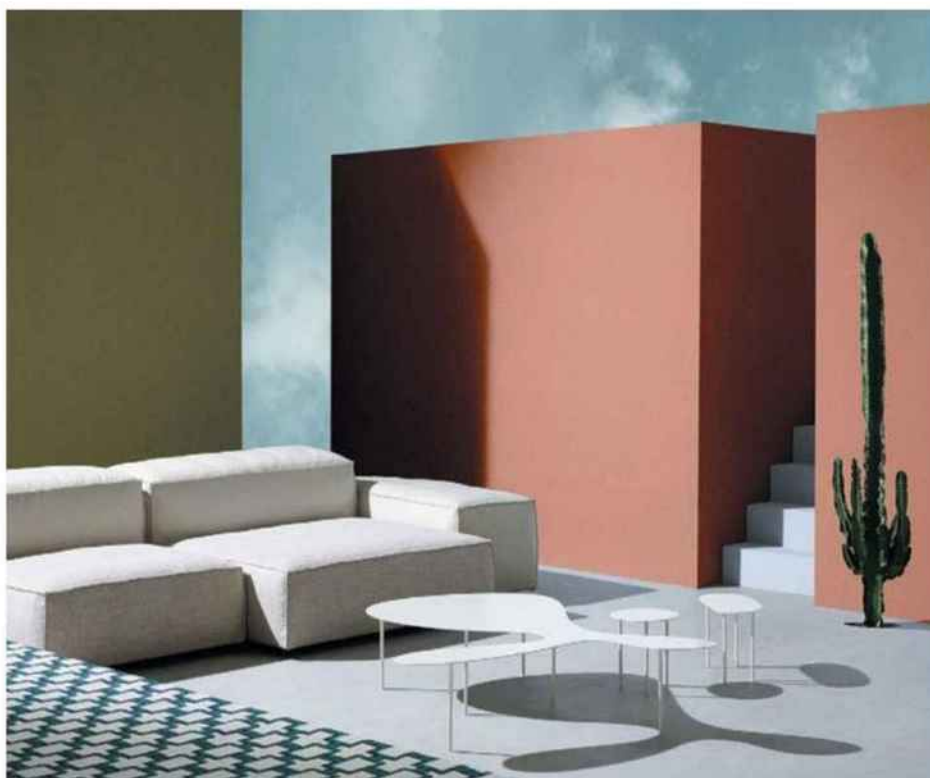
(En haut) Canapé Erica '19, structure en aluminium, design Antonio Citterio, B&B Italia. Deux tables basses Bebop, plateau aluminium, piètement acier, design Tristan Löhner, Fermob. Parasol Umbrella en fibre de verre, base en granit, Sifas. Tasses à café en céramique, Revol chez Fleux. (Ci-dessus) Canapé modulable Extrasoft, revêtement déhoussable en jersey, design Piero Lissoni, Living Divani chez My Design. Tables Tortoise et Rabbit, plateau en tôle d'acier, design Studio Juju, Living Divani chez My Design. Tissus Young & Lovely, polyester, Dedar.